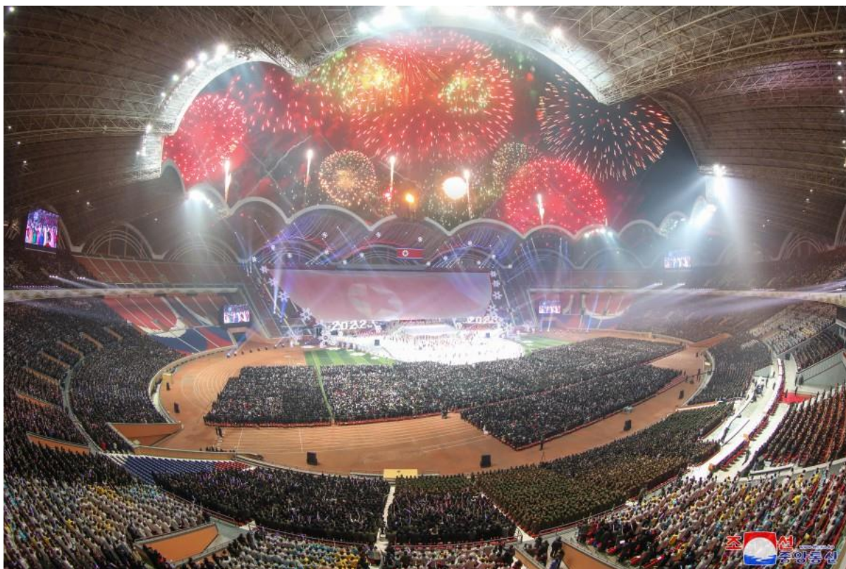
Новогодишно тържество и концерт на стадион Първи май

След това се проведе церемония по издигането на националното знаме под звуците на националния химн.