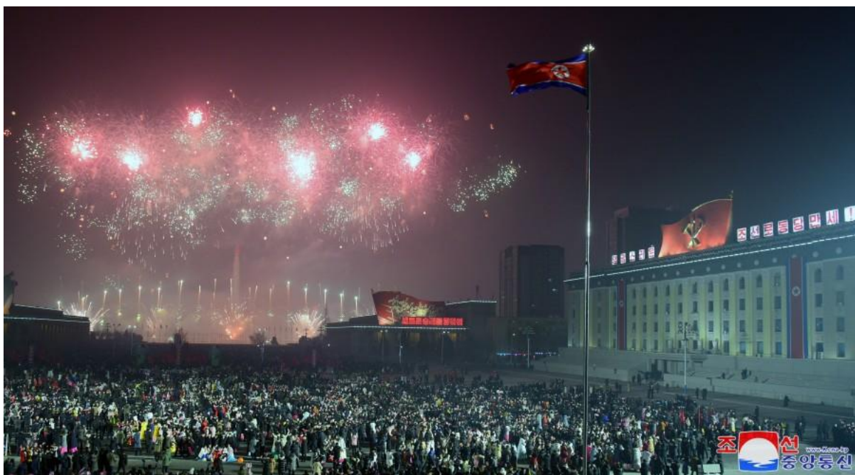
Новогодишни фойерверки на площад Ким Ир Сен в Пхенян