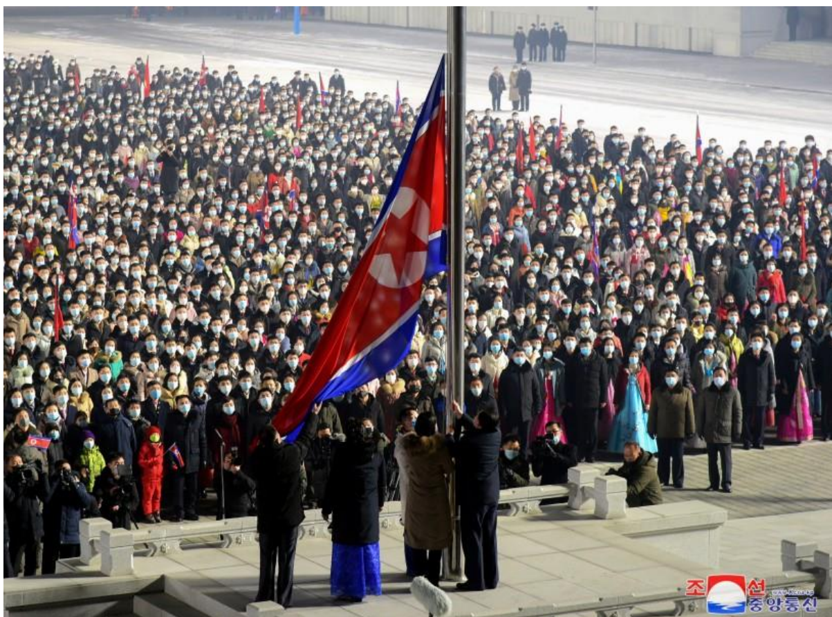
Церемонията по издигане националния флаг на площад Ким Ир Сен