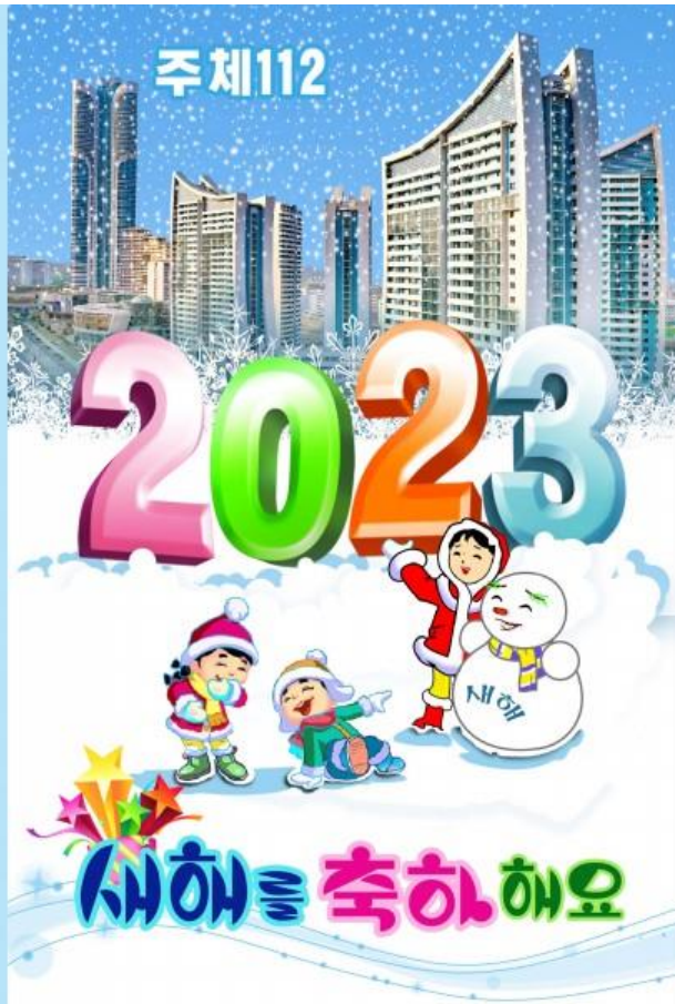
Новогодишни картички от КНДР